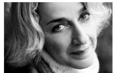
Carole Zalberg