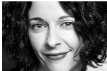
Anne Plantagenet