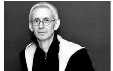
Patrick Pécherot