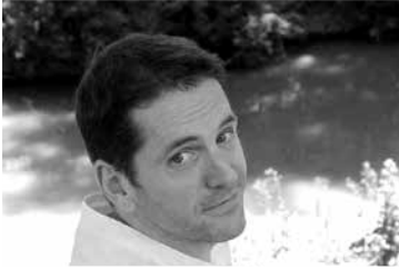
Patrick Autréaux