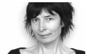
Lucile Bordes

UNE AUTEUR EN RÉSIDENCE À MOIRANS-EN-MONTAGNE (JURA)