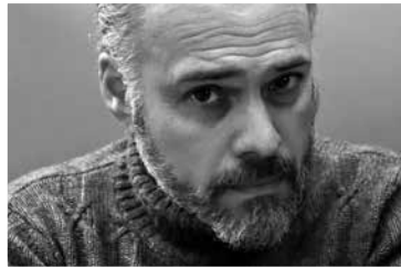
Joseph Incardona