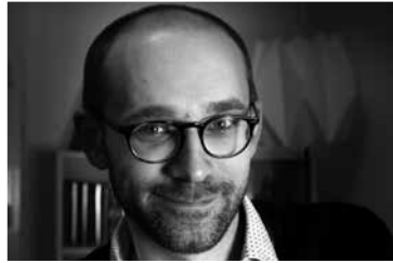
Arnaud Dudek