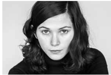
Julia Kerninon