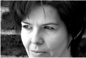
Julia Deck